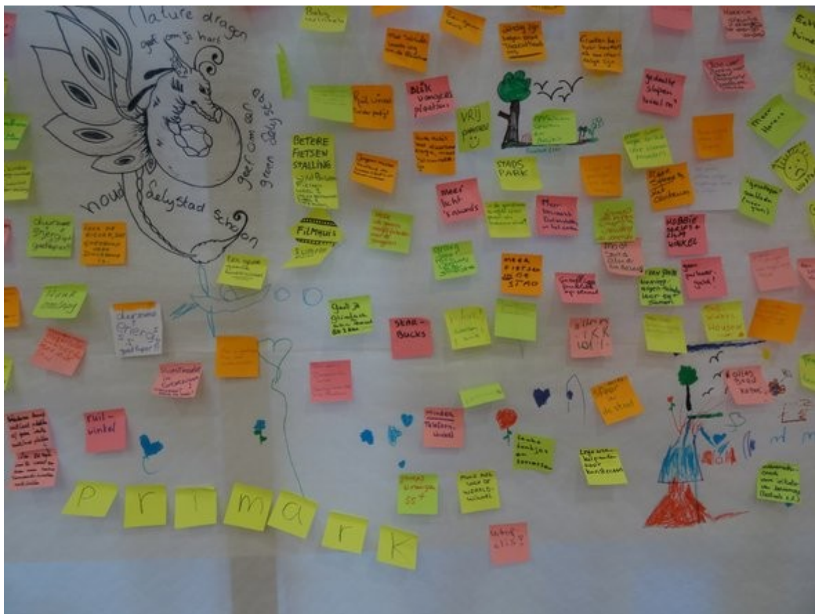
Tekeningen luisteren ideeënmuur op!

Naast alle bijdrages zijn er ook diverse prachtige tekeningen gemaakt, al dan niet met een betekenis. Zie hieronder voor een voorbeeld.