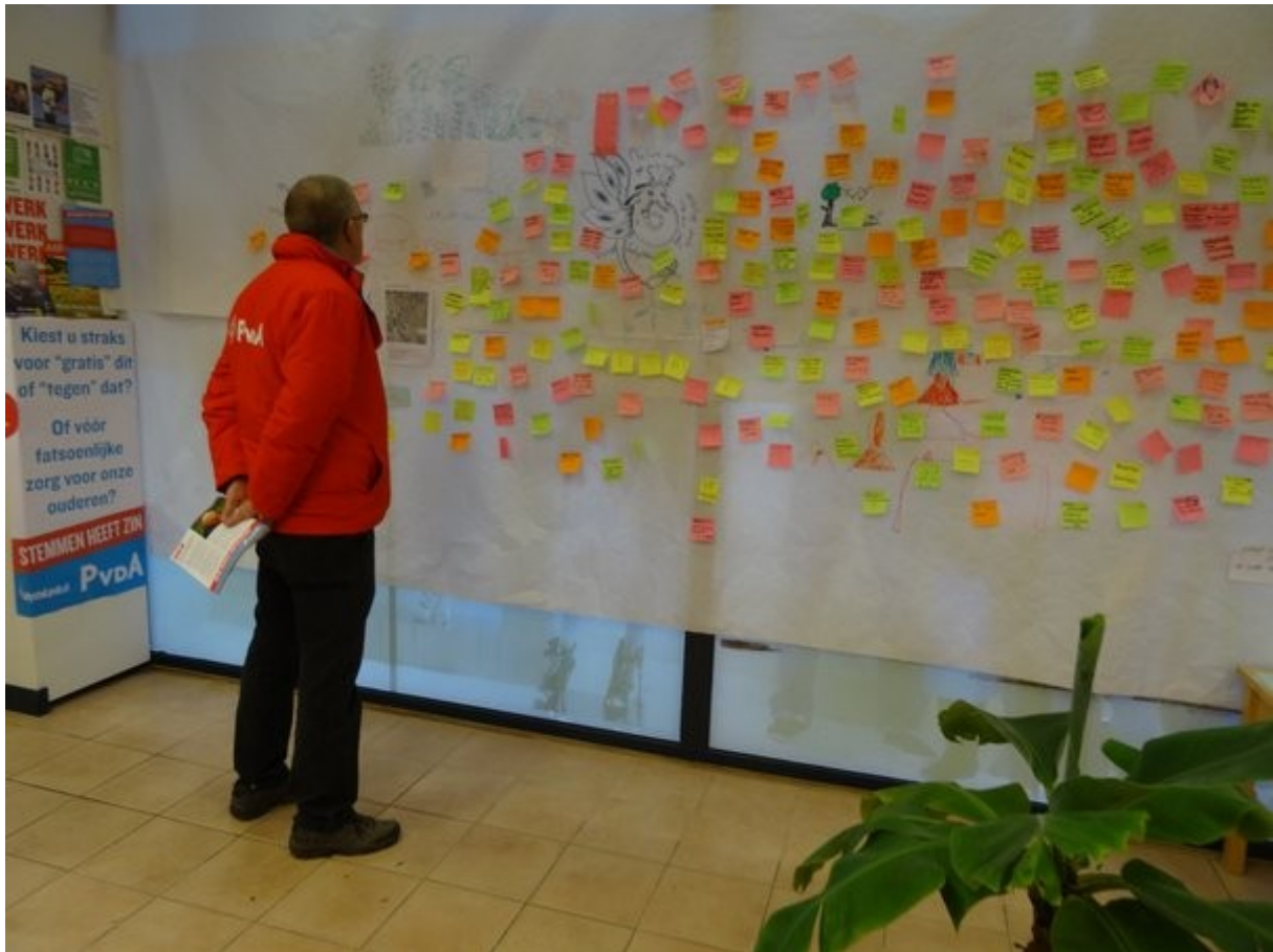
Ook andere politieke partijen zijn geïnteresseerd in het resultaat

schrijven en opplakken op onze fysieke ideeënmuur. Het resultaat was overweldigend, zoals te zien is op onderstaande foto.