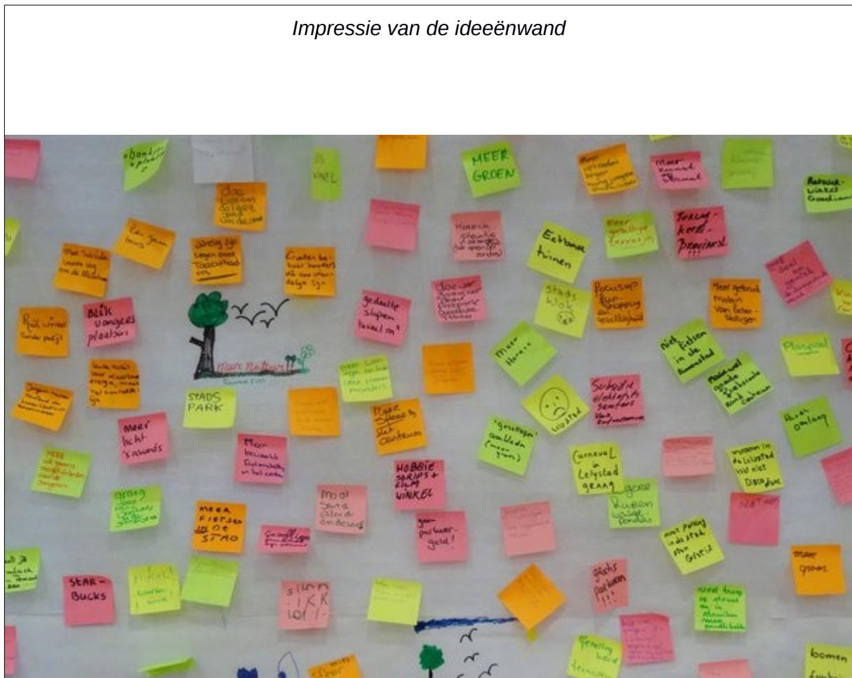
Impressie van de ideeënwand

Om het college een eindje op weg te helpen zal GroenLinks de meest bruikbare ideeën opnemen in een initiatiefvoorstel. Zo heeft het college alvast alle benodigde acties op een rij.